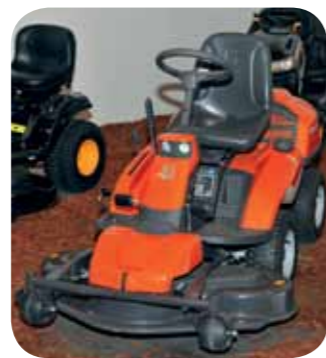
KOGRA Sejem komunale, urejanja okolje in ekologije