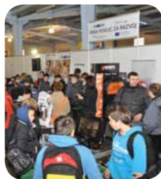
POS Pomurski obrnno-podjetniški sejem