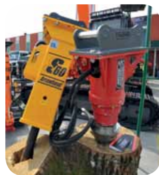
MEGRA Sejem gradbeništva