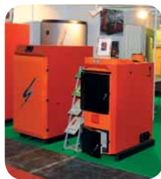
ENGRA Sejem energetike